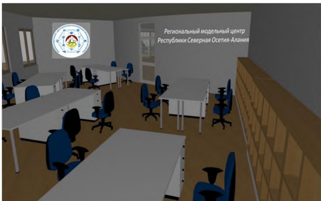
5. Трансформируемое помещение (коворкинг)