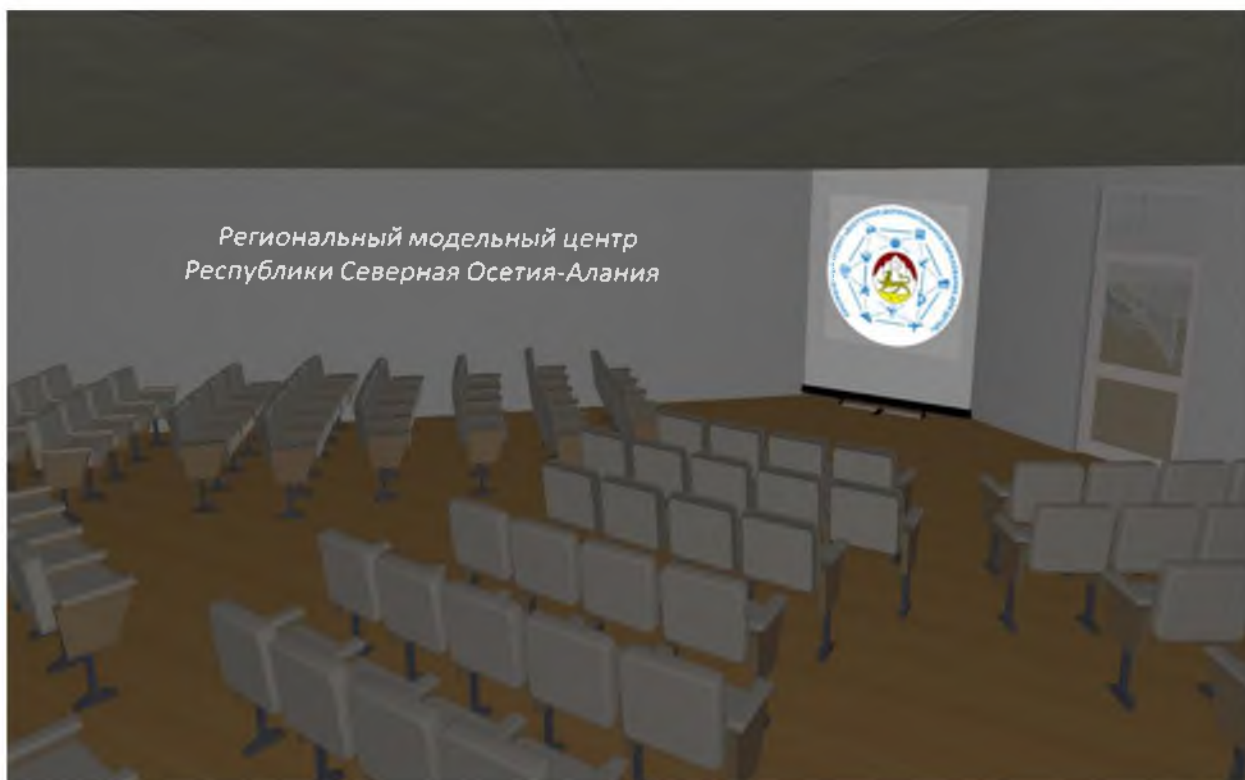
4. Трансформируемое помещение (лекторий)